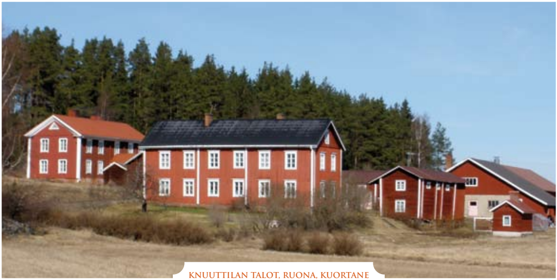
KNUUTTILAN TALOT, RUONA, KUORTANE